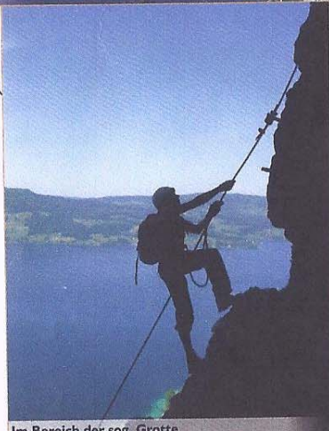
Im Bereich der sog. Grotte